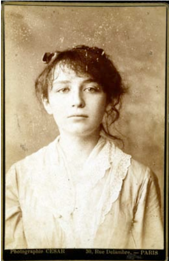
Portrait de Camille Claudel à 18 ans