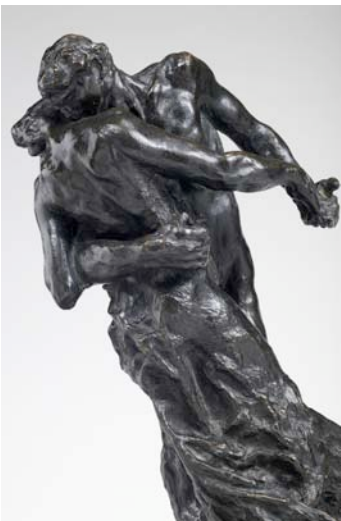
La Valse ©Musée Rodin (Photo Ch. Baraja) ©ADAGP, Paris