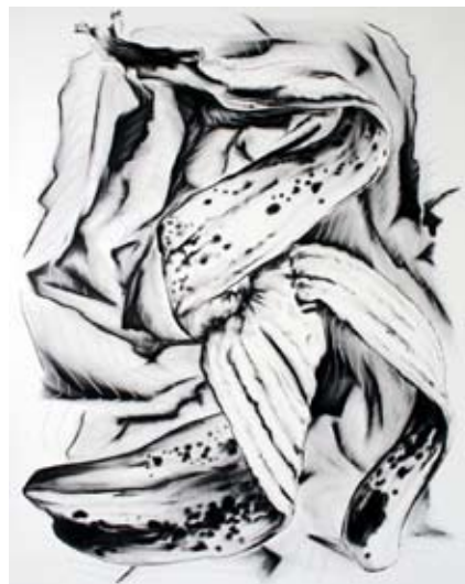
Armand Jalut, La peau de banane , 2009 Huile sur toile, 150 x 120 cm