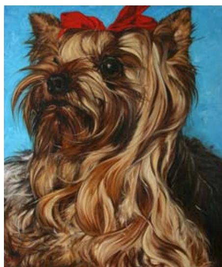
Armand Jalut, Le Yorkshire , 2008 Huile sur toile, 195 x 162 cm