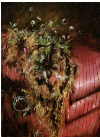
Armand Jalut, Le Canapé , 2008 Huile sur toile, 100 x 73 cm