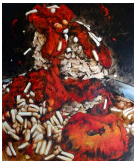
Armand Jalut, Tomate farcie , 2008 Huile sur toile, 195 x 162 cm