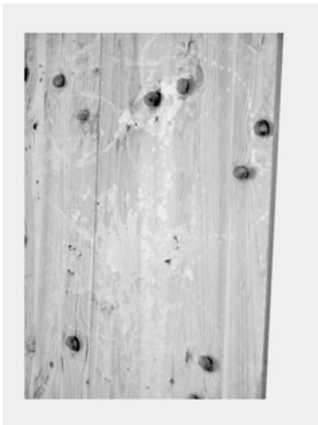
Maxime Rossi, Glissement , 2008 Coquilles et bave d'escargots, vernis, bois, colle 60 x 120 cm / 240 x 120 cm