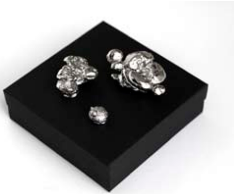
Maxime Rossi, True Spirit (aspirine) , 2002 Bronze chromé, dimensions variables