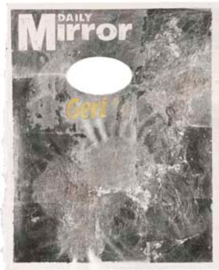
Maxime Rossi, Young Lady (geri) , 2009 Feuille d'argent, oxydation, Daily Mirror , cadre découpé au dos, 70 x 64 cm